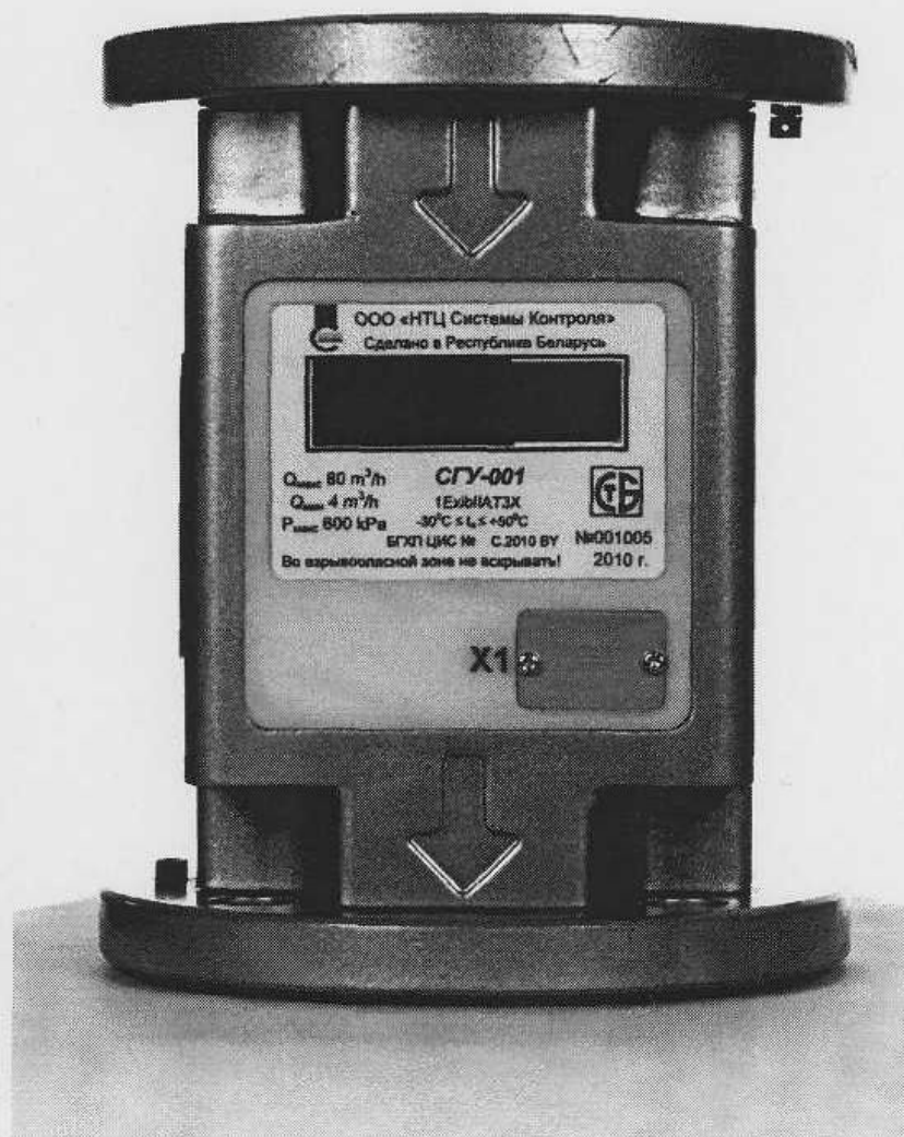
Рисунок 1 – Внешний вид счётчика.

Схема пломбировки от несанкционированного доступа и место для нанесения знака поверки в виде клейма-наклейки приведены в Приложении А.