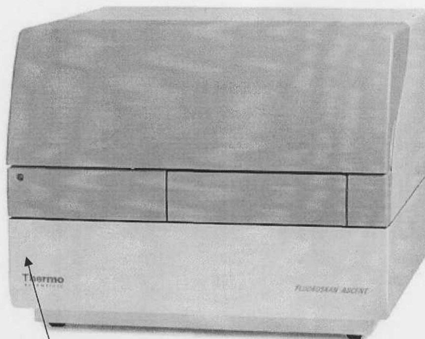
Схема с указанием места нанесения знака поверки в виде клейма-наклейки

Место нанесения знака поверки в виде клейма-наклейки