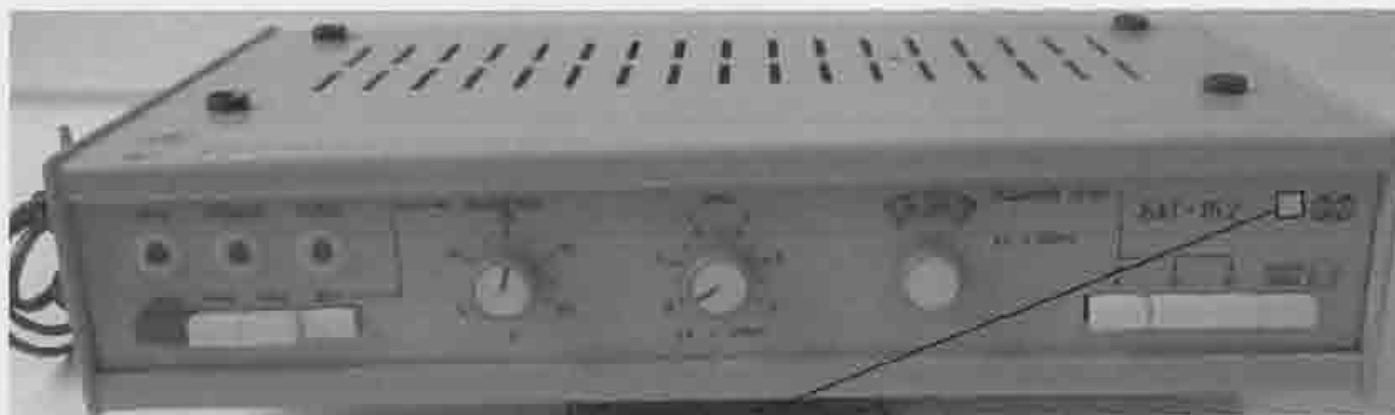
Место нанесения поверительного клейма