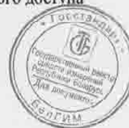
Рисунок А.2 – Схема опломбирования приборов от несанкционированного доступа