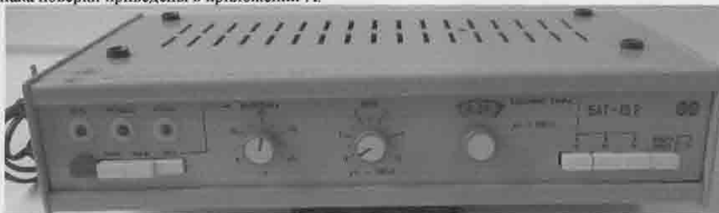
Рисунок 1 – Общий вид блока автоматического титрования БАТ-15.2

Схема опломбирования от несанкционированного доступа и схема нанесения на приборы знака поверки приведены в приложении А.