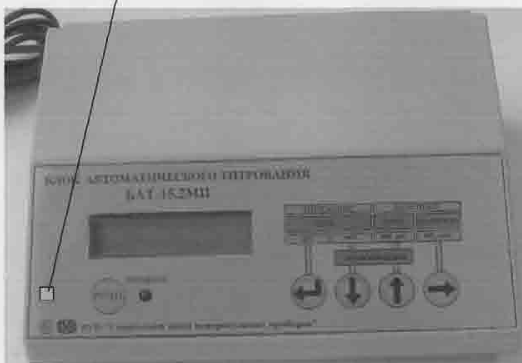
Рисунок А.1 – схема нанесения на приборы знака поверки