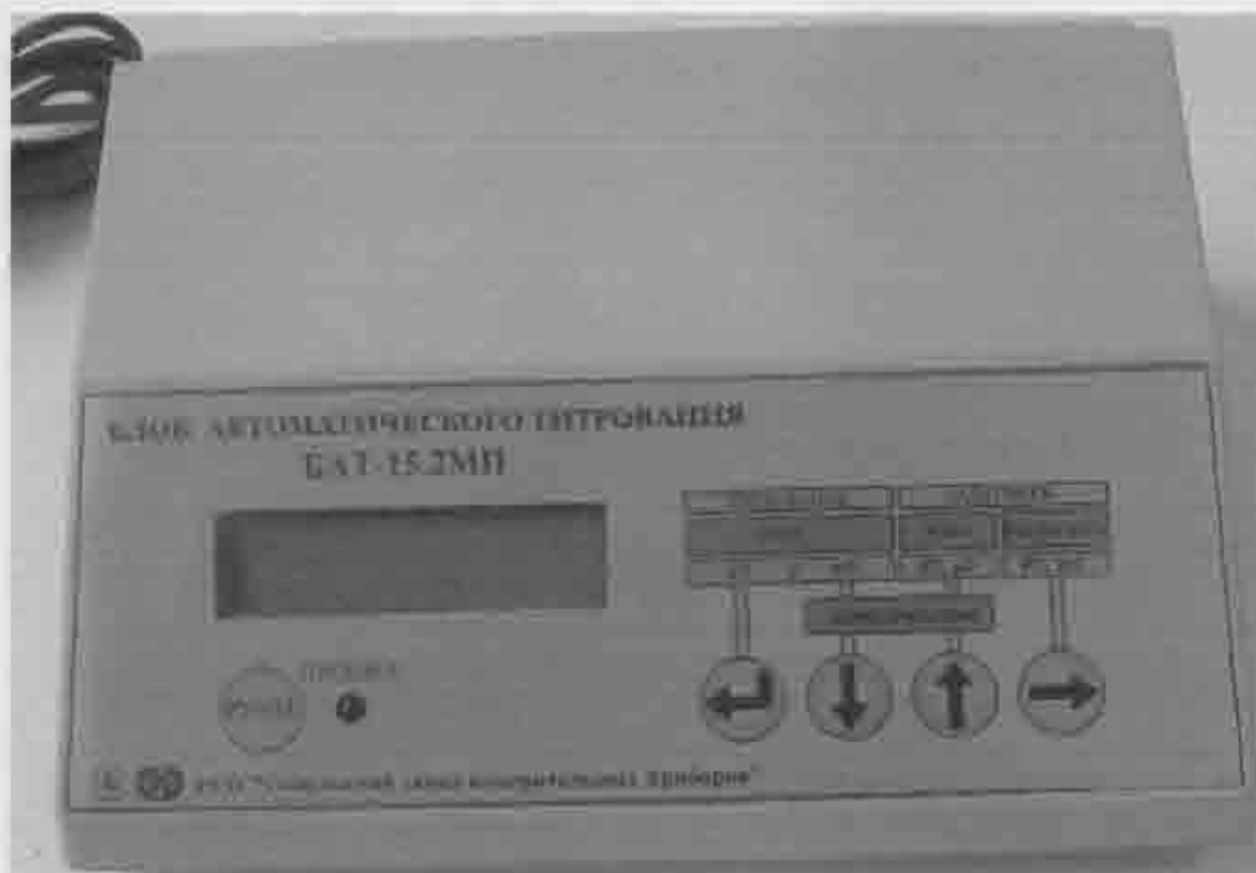
Рисунок 2 – Общий вид блока автоматического титрования БАТ-15.2МП