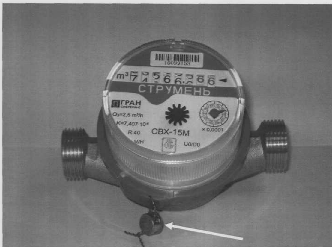
Рисунок 1А - Место пломбирования и нанесения оттиска поверительного клейма на счетчики воды крыльчатые "СТРУМЕНЬ"