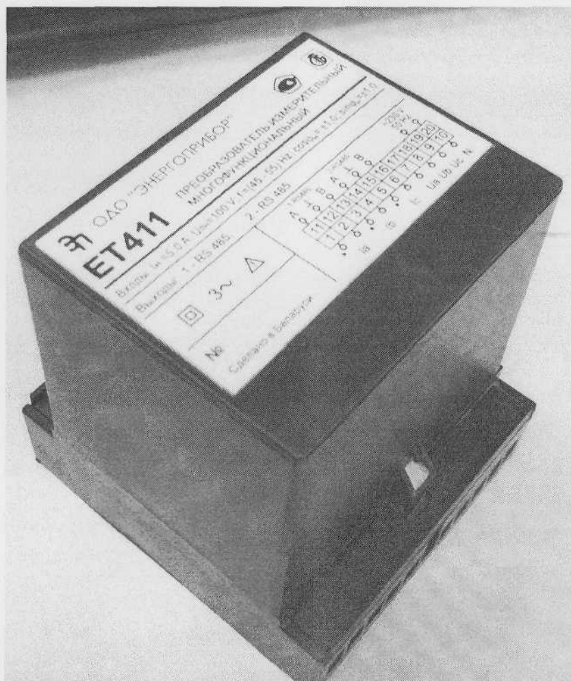
Рисунок 2. Фотография общего вида