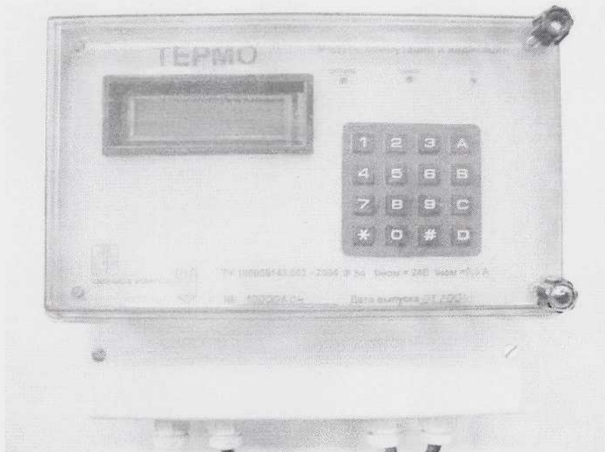
Рисунок 1 – Внешний вид модуля коммутации и индикации.