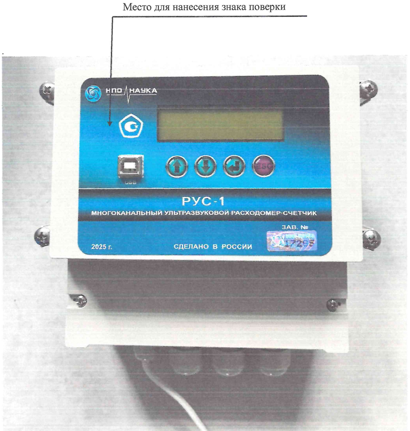
Рисунок 2.1 – Схема (рисунок) с указанием места для нанесения знака поверки расходомера-счетчика ультразвукового РУС-1 № 17285

Схема (рисунок) с указанием места для нанесения знака поверки средств измерений