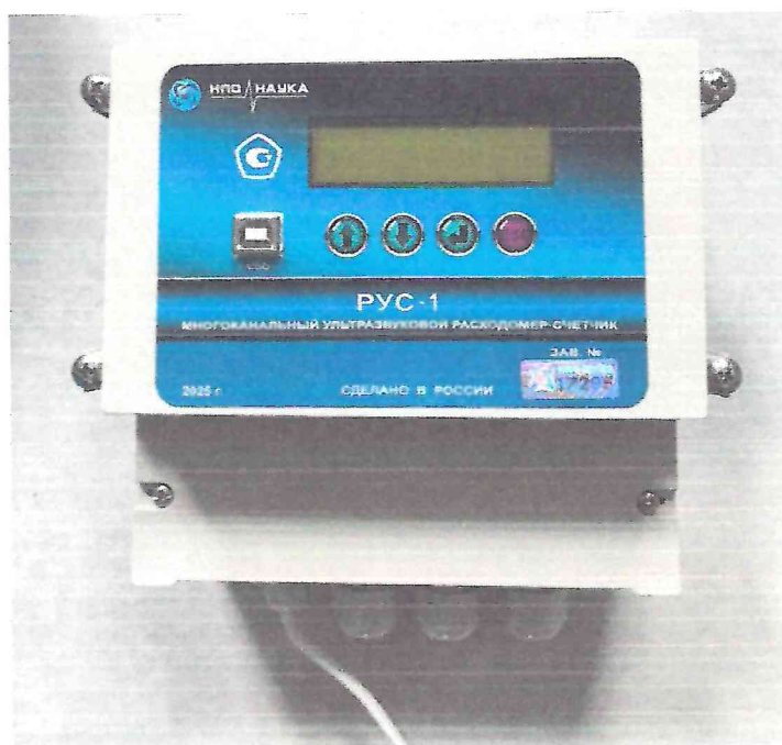
Рисунок 1.3 – Фотография общего вида электронного блока (ЭБ) расходомера-счетчика ультразвукового РУС-1 № 17285