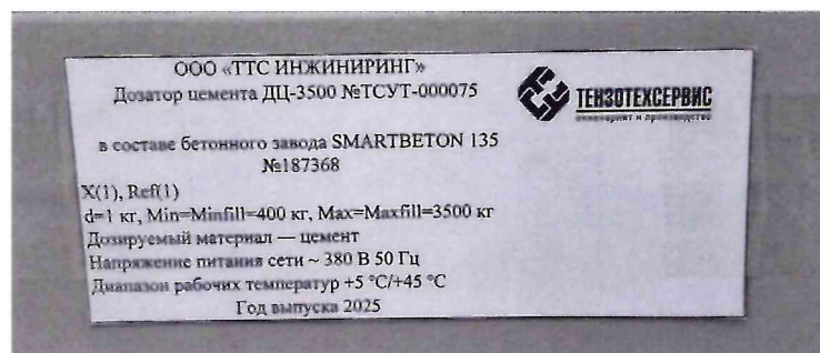
Рисунок 1.2 – Фотография маркировки дозатора цемента ДЦ-3500 № ТСУТ-000075 в составе бетонного завода SMARTBETON 135 № 187368