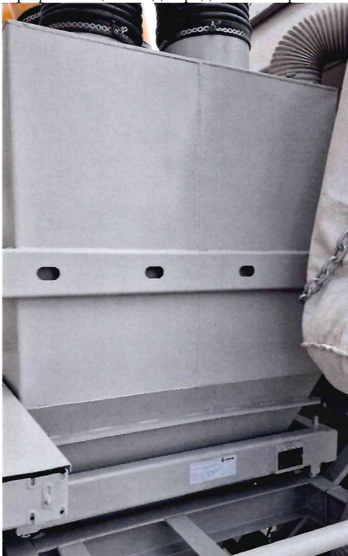
Рисунок 1.1 – Фотография внешнего вида дозатора цемента ДЦ-3500 № ТСУТ-000075 в составе бетонного завода SMARTBETON 135 № 187368