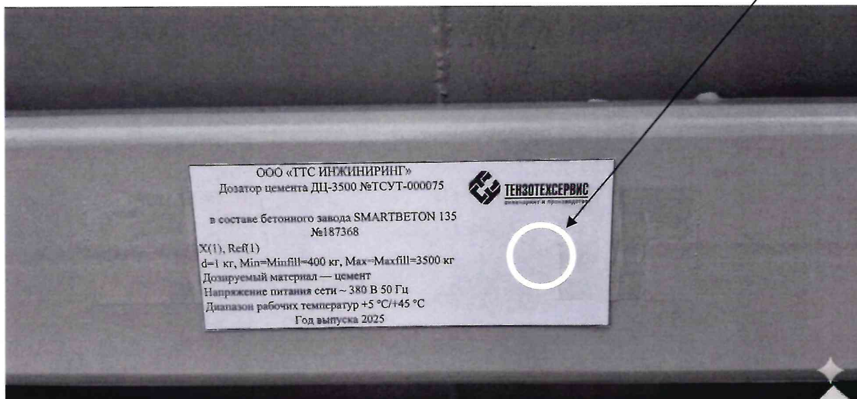
Рисунок 2.1 - Фотография с указанием места нанесения знака поверки (наклейки) на маркировочную табличку дозатора цемента ДЦ-3500 № ТСУТ-000075 в составе бетонного завода SMARTBETON 135 № 187368

Место нанесения знака поверки (наклейки)