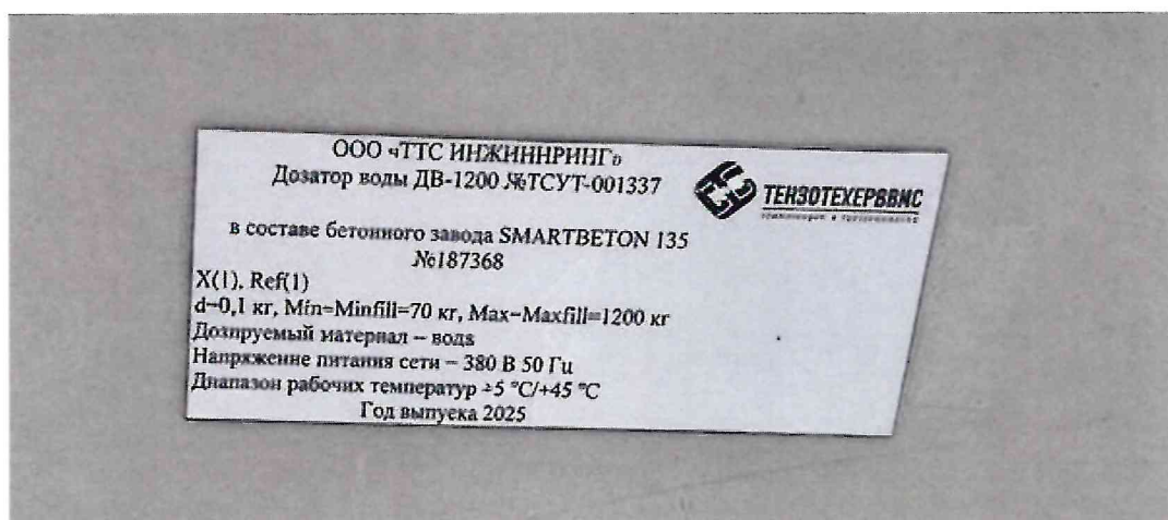
Рисунок 1.2 – Фотография маркировки дозатора воды ДВ-1200 № ТСУТ-001337 в составе бетонного завода SMARTBETON 135 № 187368