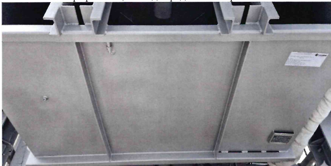
Рисунок 1.1 – Фотография внешнего вида дозатора воды ДВ-1200 № ТСУТ-001337 в составе бетонного завода SMARTBETON 135 № 187368