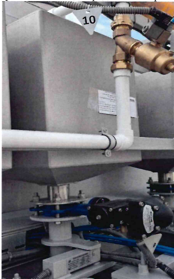
Рисунок 1.1 – Фотография внешнего вида дозатора химических добавок ДХД-50 № ТСУТ-000013-2 в составе бетонного завода SMARTBETON 135 № 187368

Фотография общего вида средства измерений