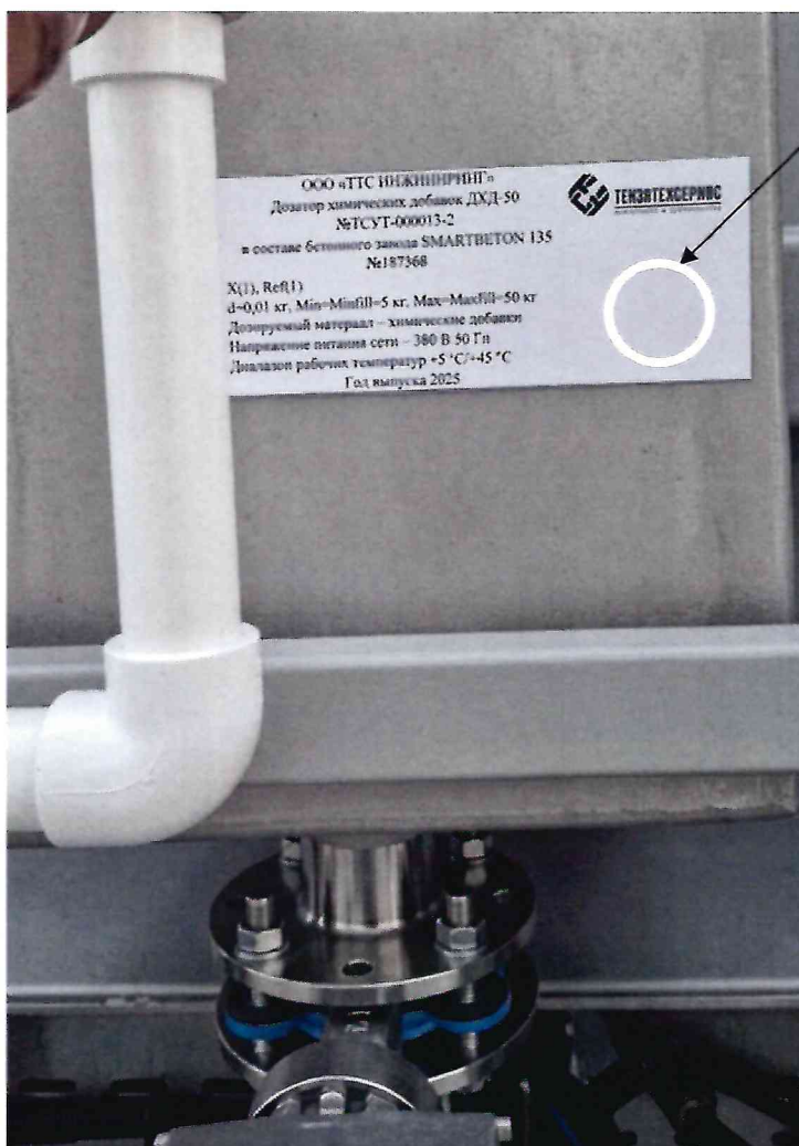
Рисунок 2.1 - Фотография с указанием места нанесения знака поверки (наклейки) на маркировочную табличку дозатора химических добавок ДХД-50 № ТСУТ-000013-2 в составе бетонного завода SMARTBETON 135 № 187368

Место нанесения знака поверки (наклейки)