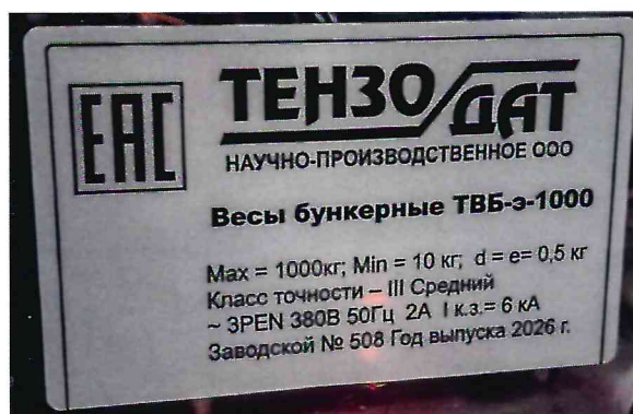
Рисунок 1.2 – Фотография маркировки весов бункерных ТВБ-э-1000 № 508