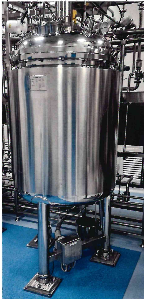
Рисунок 1.1 – Фотография внешнего вида весов бункерных ТВБ-э-1000 № 508