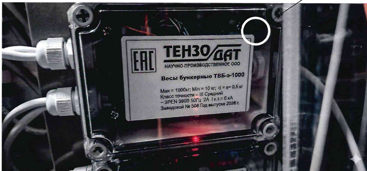
Рисунок 2.1 - Фотография с указанием места нанесения знака поверки (наклейки) на корпус ПТН весов бункерных ТВБ-э-1000 № 508.

Место нанесения знака поверки (наклейки)