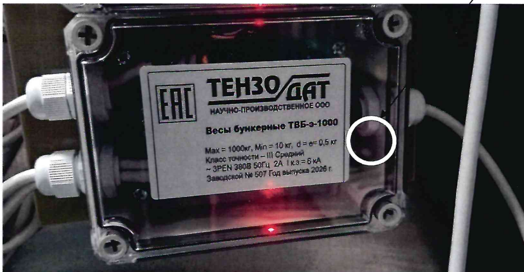
Рисунок 2.1 - Фотография с указанием места нанесения знака поверки (наклейки) на корпус ПТН весов бункерных ТВБ-э-1000 № 507.

Место нанесения знака поверки (наклейки)