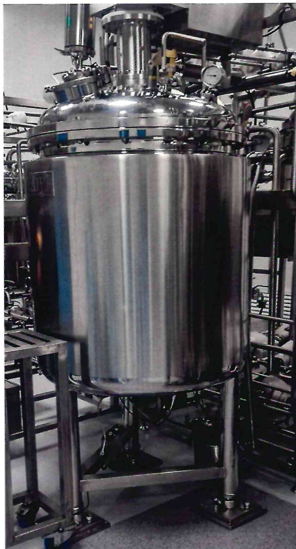
Рисунок 1.1 – Фотография внешнего вида весов бункерных ТВБ-э-1000 № 507