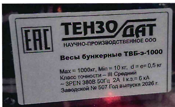
Рисунок 1.2 – Фотография маркировки весов бункерных ТВБ-э-1000 № 507