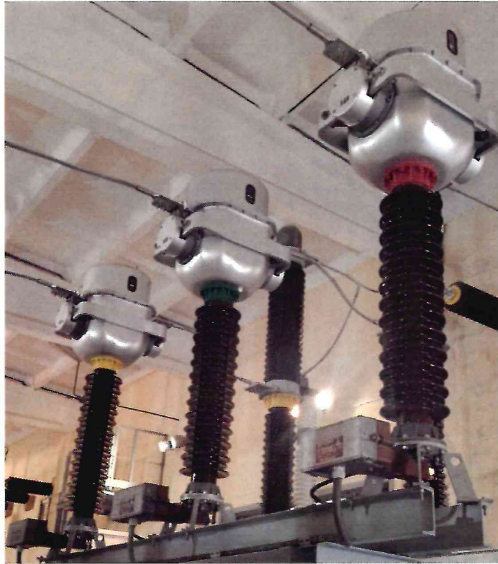
Рисунок 1.1 – Фотографии внешнего вида трансформатора тока СА-123 № 0512098/2