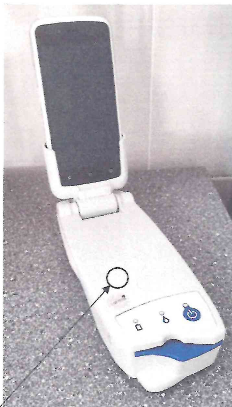
Схема (рисунок) с указанием места для нанесения знака поверки средства измерений

Место для нанесения знака поверки (клеймо-наклейка)