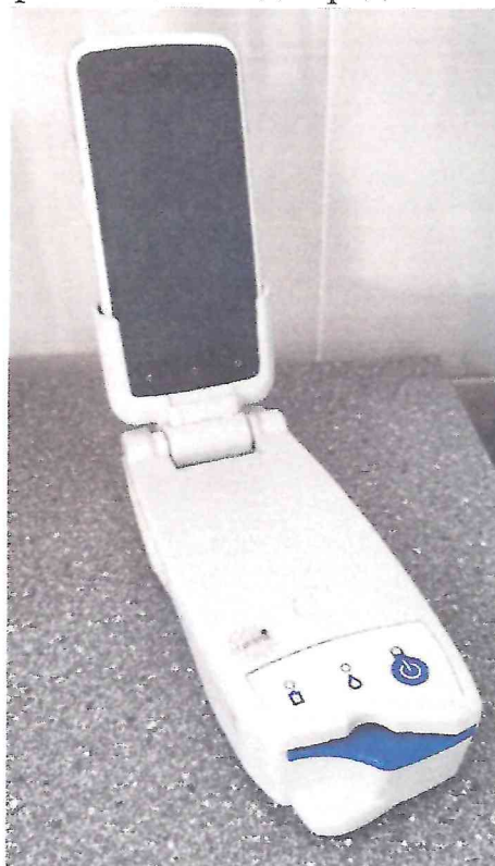
Рисунок 1.1 – Фотография общего вида анализатора