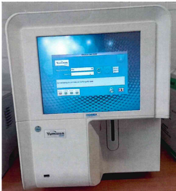
Рисунок 1.1 – Фотография общего вида анализатора гематологического автоматического Yumizen H500 OT № 803YOXH01323