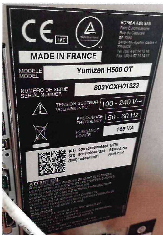
Рисунок 1.2 – Фотография маркировки анализатора гематологического автоматического Yumizen H500 OT № 803YOXH01323