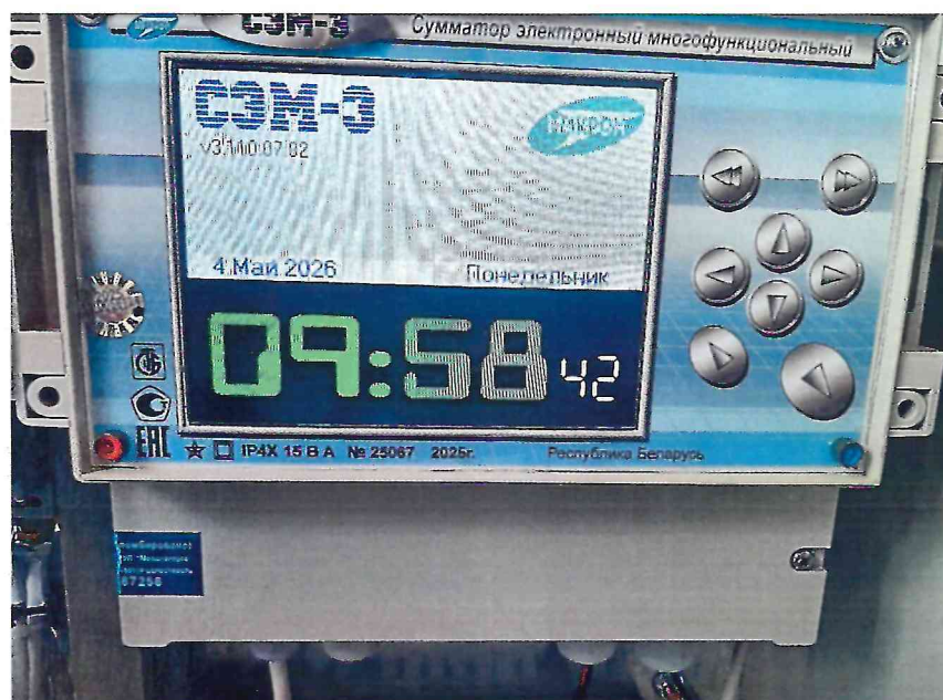
б) сумматор в шкафу АСКУЭ