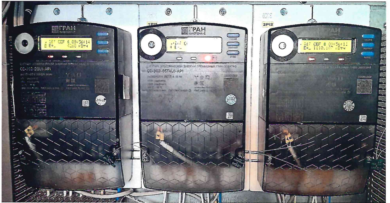
Рисунок 1.2 – Фотография счётчиков, входящих в состав измерительных каналов АСКУЭ (изображение носит иллюстративный характер)