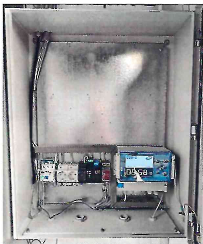
а) шкаф АСКУЭ