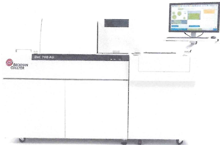
Рисунок 1.1 – Фотография общего вида анализатора биохимического DxC 700 AU № 2023023404