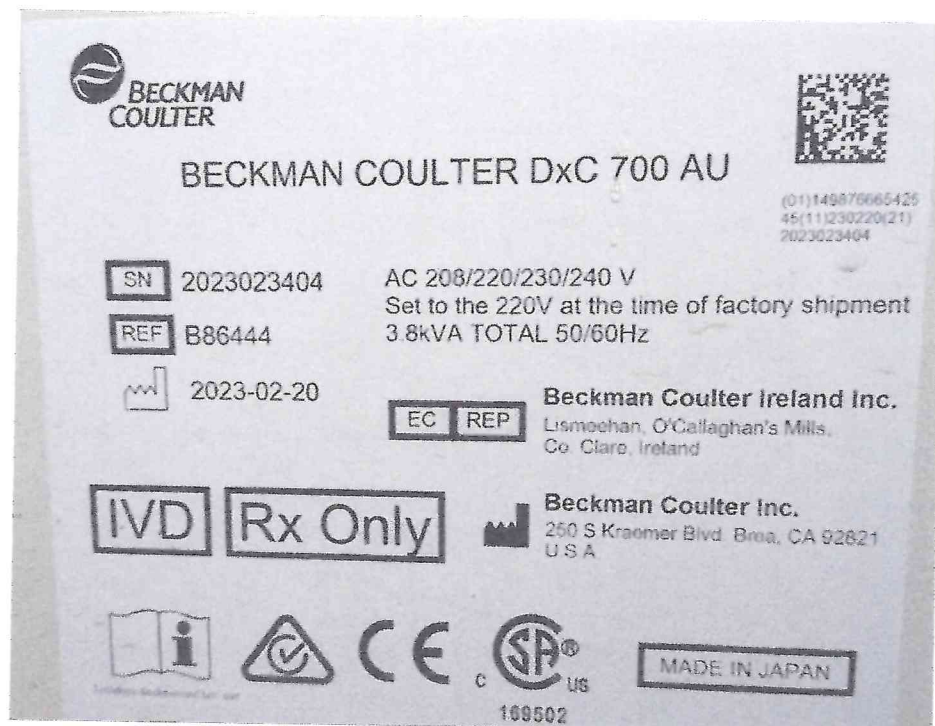
Рисунок 1.2 – Фотография маркировки анализатора биохимического DxC 700 AU № 2023023404