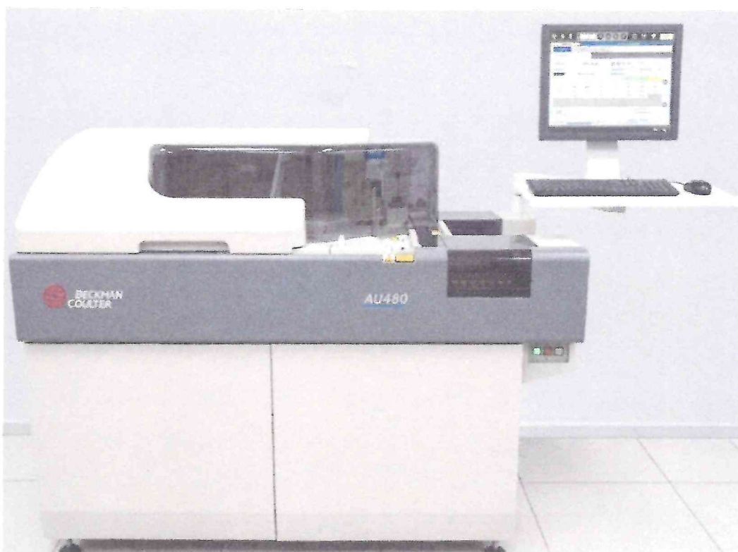
Рисунок 1.1 – Фотография общего вида анализатора биохимического AU480 № 20211043082

Фотографии общего вида средства измерений