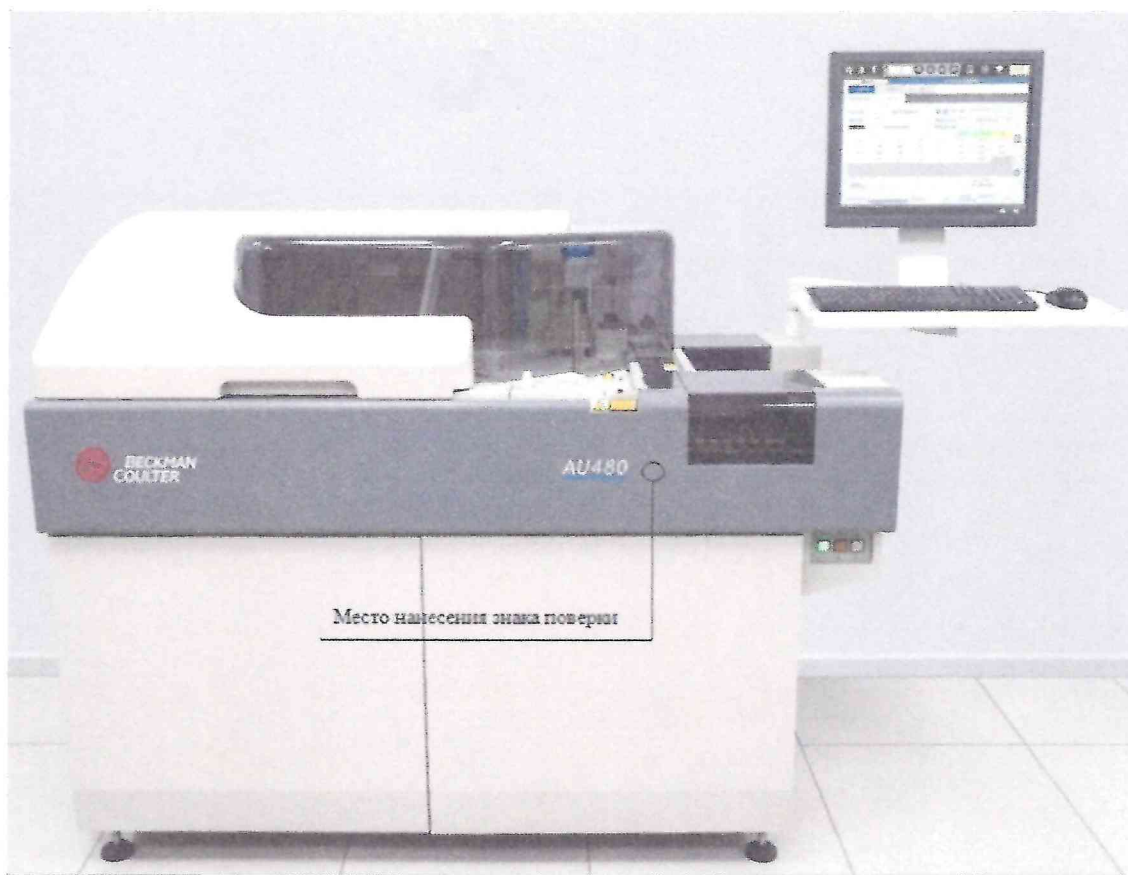
Рисунок 2.1 - Схема (рисунок) с указанием места для нанесения знака поверки средства измерений

Схема (рисунок) с указанием места для нанесения знака поверки средства измерений