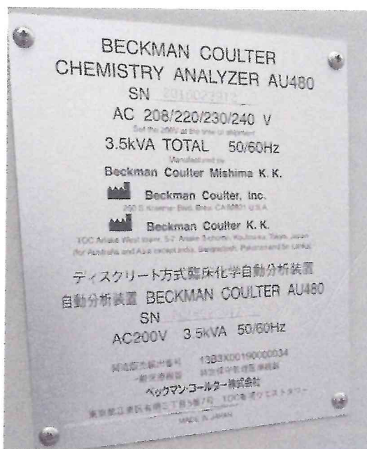
Рисунок 1.2 – Фотография маркировки анализатора биохимического AU480 № 2015023912