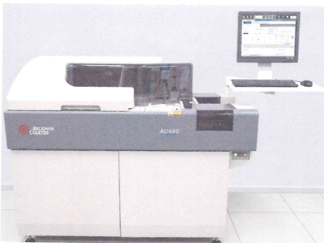
Рисунок 1.1 – Фотография общего вида анализатора биохимического AU480 № 2015023912