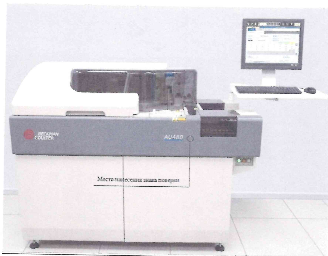
Рисунок 2.1 - Схема (рисунок) с указанием места для нанесения знака поверки средства измерений

Схема (рисунок) с указанием места для нанесения знака поверки средства измерений