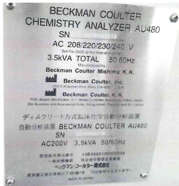
Рисунок 1.2 – Фотография маркировки анализатора биохимического AU480 № 2016093218