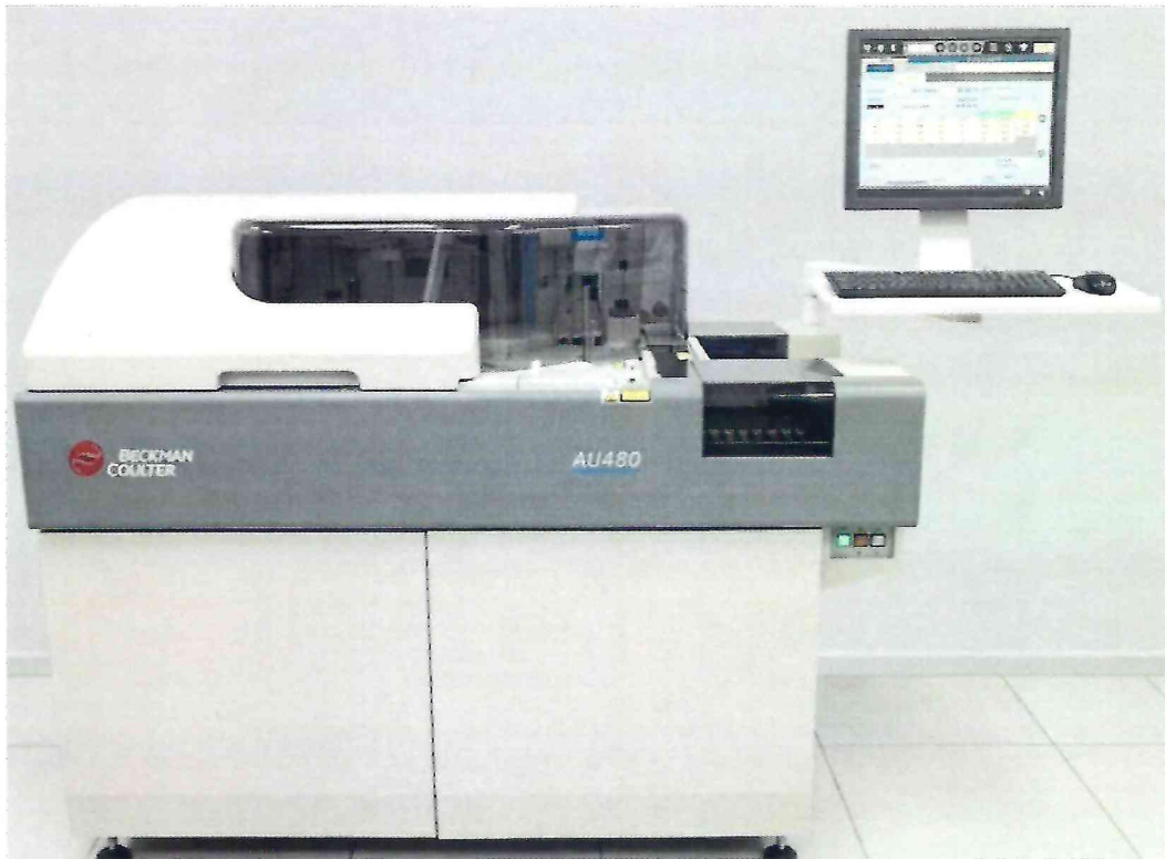
Рисунок 1.1 – Фотография общего вида анализатора биохимического AU480 № 2016093218

Фотографии общего вида средства измерений