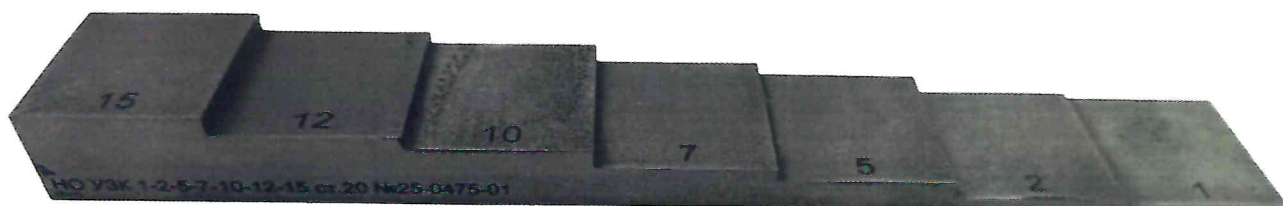
Рисунок 1.1 – Фотография общего вида Настроечный образец НО УЗК – стандартный образец предприятия типа «Ступенька» № 25-0475-01