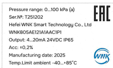
Рисунок 1.2 – Образец маркировки преобразователя давления измерительного WNK805 (изображение носит иллюстративный характер)