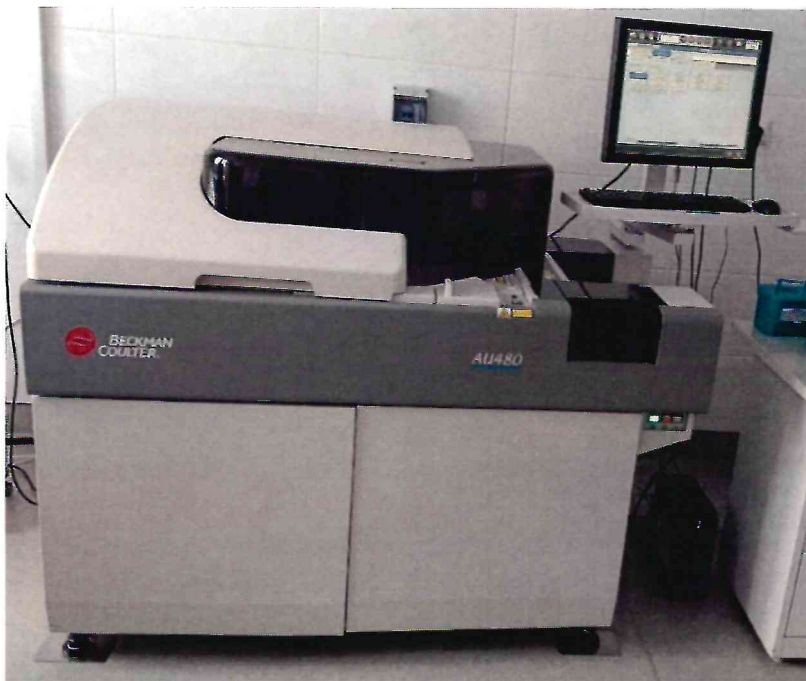
Рисунок 1.1 – Фотография общего вида анализатора биохимического AU480 № 2023070764