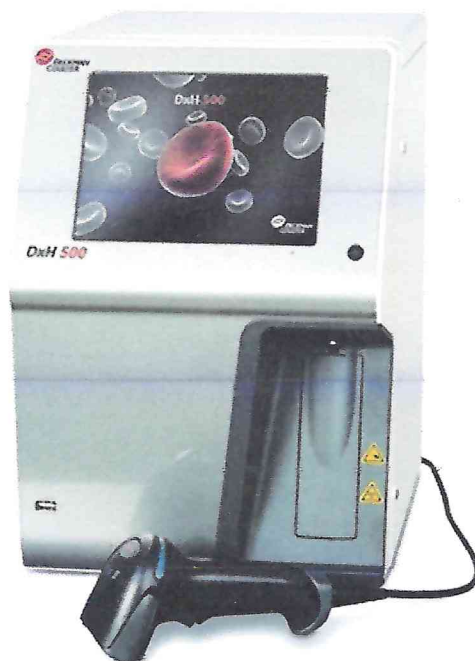
Рисунок 1.1 – Фотография общего вида анализатора гематологического автоматического DxH 500