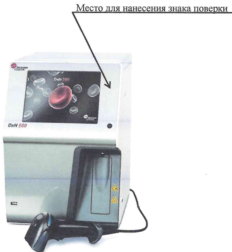
Рисунок 2 – Схема (рисунок) с указанием места для нанесения знака поверки

Схема (рисунок) с указанием места для нанесения знака поверки средства измерений