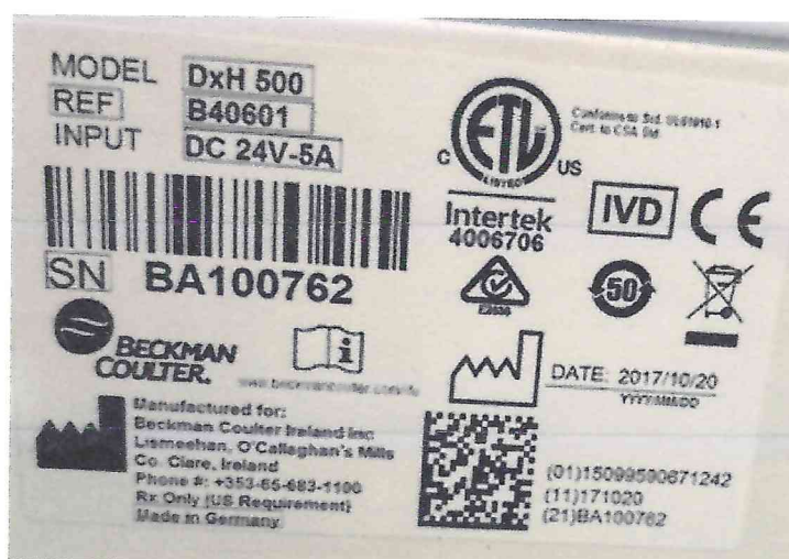
Рисунок 1.2 – Фотография маркировки анализатора гематологического автоматического DxH 500