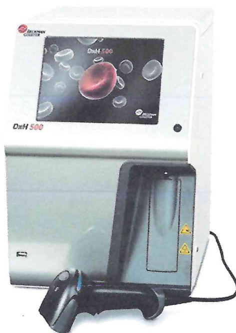
Рисунок 1.1 – Фотография общего вида анализатора гематологического автоматического DxH 500