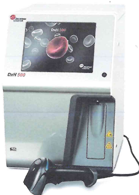
Рисунок 1.1 – Фотография общего вида анализатора гематологического автоматического DxH 500