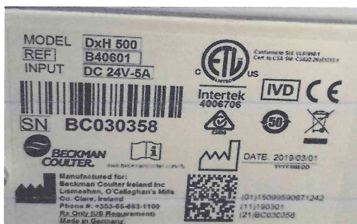
Рисунок 1.2 – Фотография маркировки анализатора гематологического автоматического DxH 500