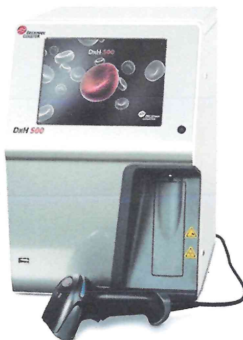
Рисунок 1.1 – Фотография общего вида анализатора гематологического автоматического DxH 500