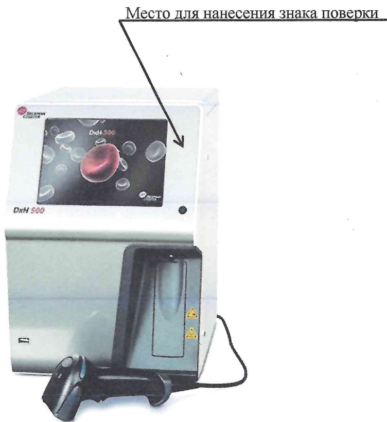
Рисунок 2 – Схема (рисунок) с указанием места для нанесения знака поверки

Схема (рисунок) с указанием места для нанесения знака поверки средства измерений