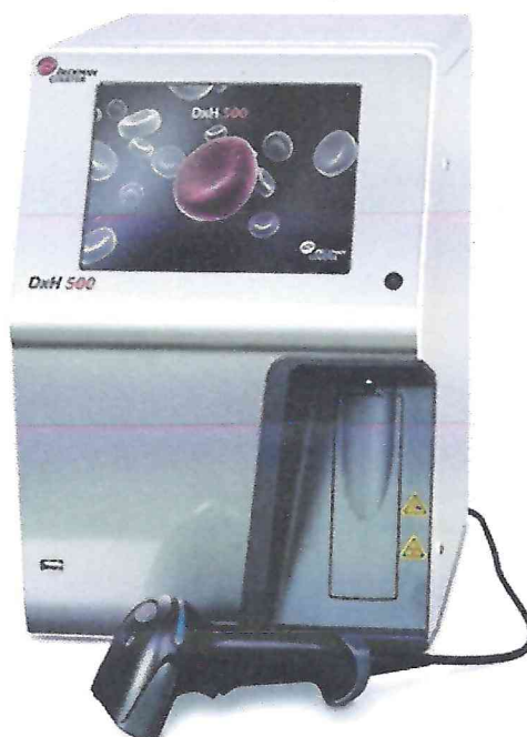
Рисунок 1.1 – Фотография общего вида анализатора гематологического автоматического DxH 500