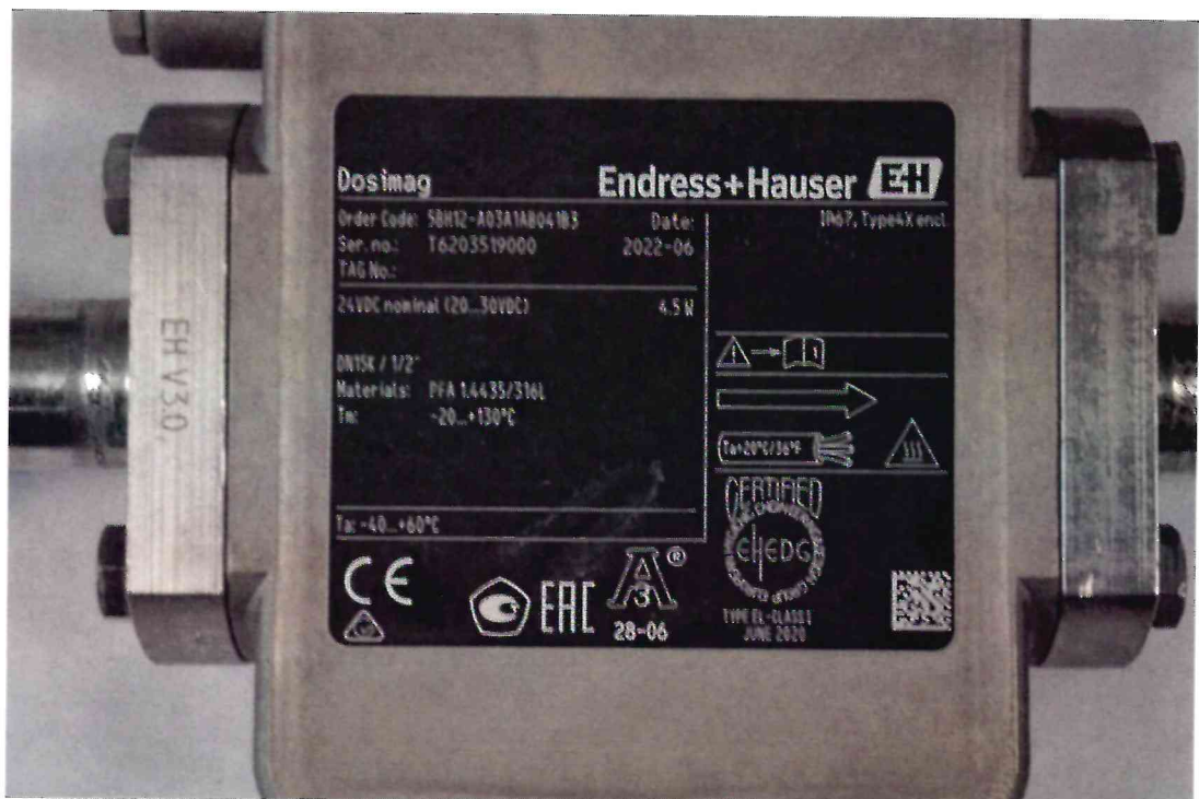
Рисунок 1.2 – Фотография маркировки расходомера электромагнитного Dosimag № T6203519000