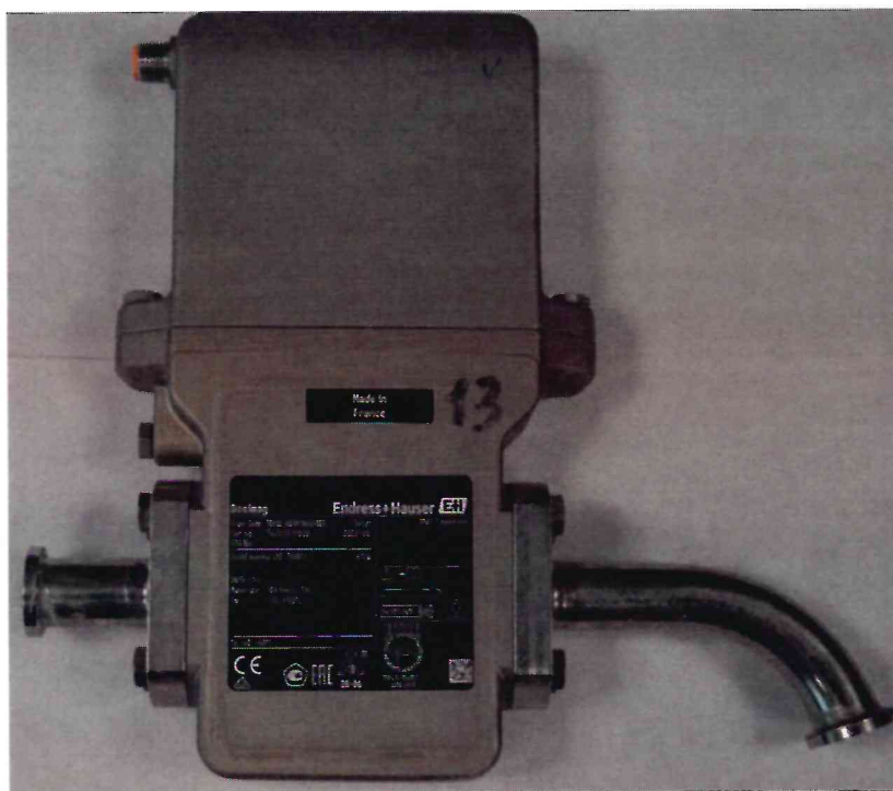
Рисунок 1.1 – Фотография общего вида расходомера электромагнитного Dosimag № T6203319000