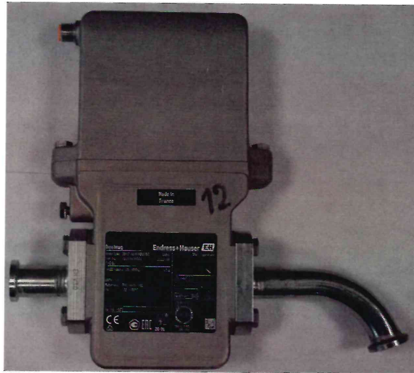
Рисунок 1.1 – Фотография общего вида расходомера электромагнитного Dosimag № T6203419000