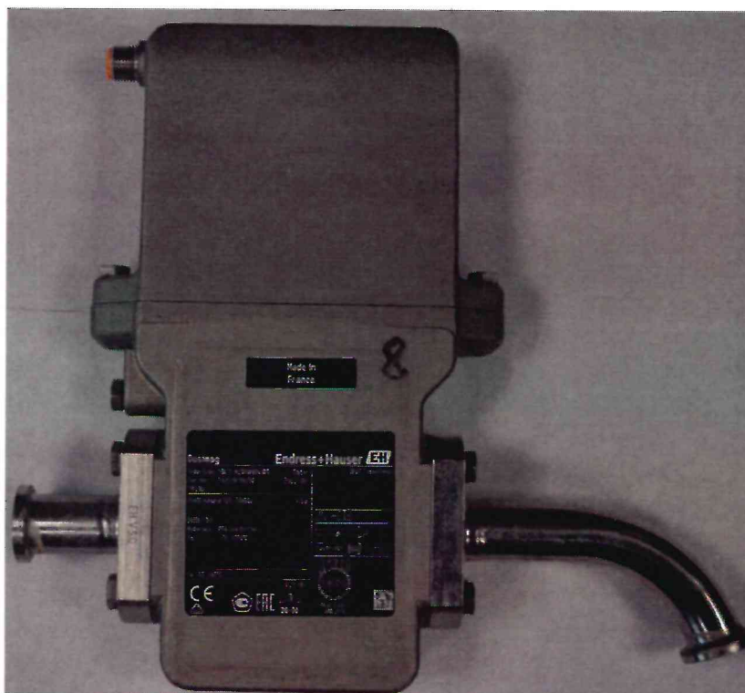
Рисунок 1.1 – Фотография общего вида расходомера электромагнитного Dosimag № T6203F19000