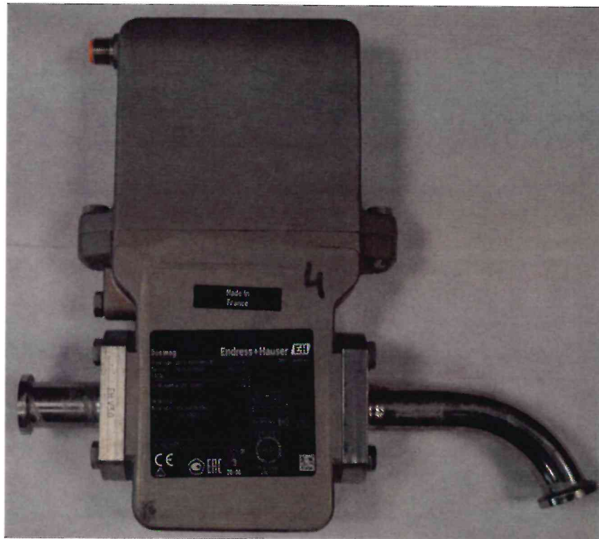
Рисунок 1.1 – Фотография общего вида расходомера электромагнитного Dosimag № T6202619000