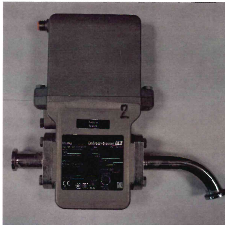
Рисунок 1.1 – Фотография общего вида расходомера электромагнитного Dosimag № T6202919000