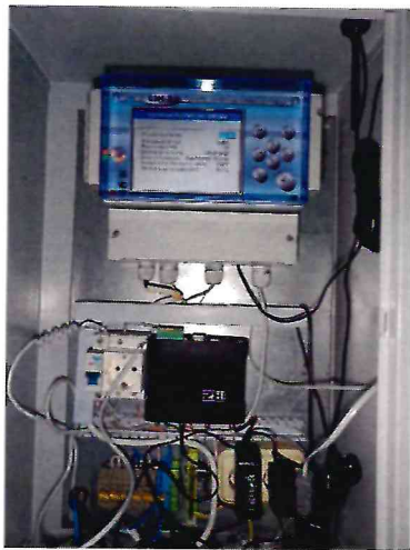
а) шкаф АСКУЭ