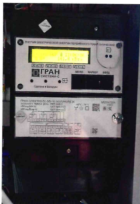
Рисунок 1.2 – Фотографии счётчиков, входящих в состав измерительных каналов АСКУЭ (изображения носят иллюстративный характер)