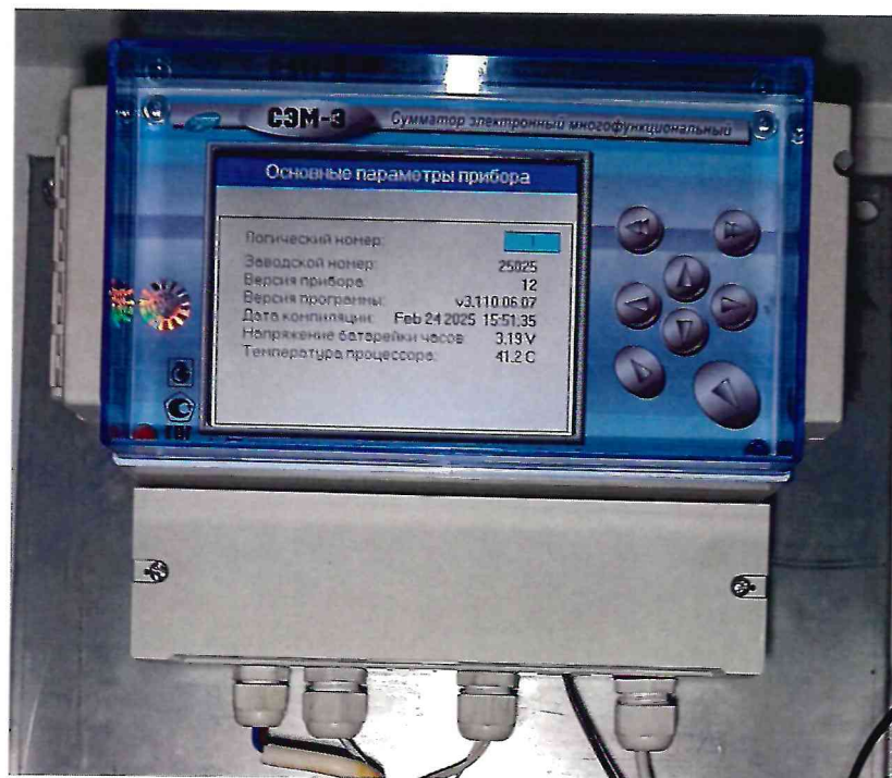
б) сумматор в шкафу АСКУЭ