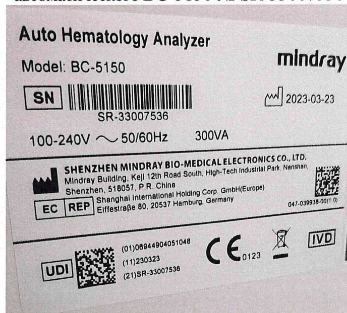
Рисунок 1.2 – Фотография маркировки анализатора гематологического автоматического BC-5150 № SR-33007536