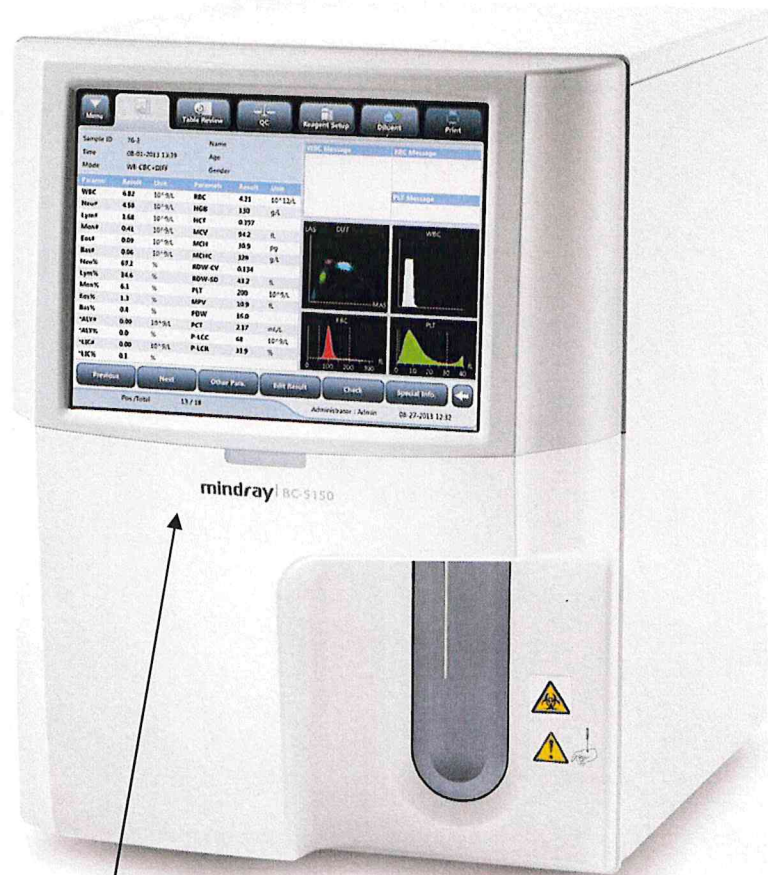
Схема (рисунок) с указанием места для нанесения знака поверки средства измерений