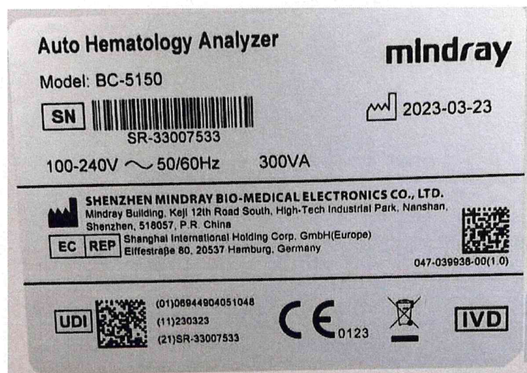
Рисунок 1.2 – Фотография маркировки анализатора гематологического автоматического BC-5150 № SR-33007533