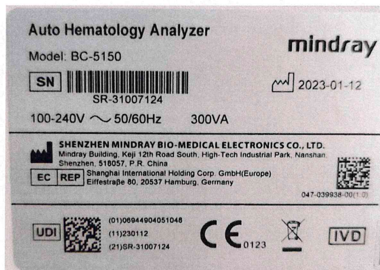
Рисунок 1.2 – Фотография маркировки анализатора гематологического автоматического BC-5150 № SR-31007124