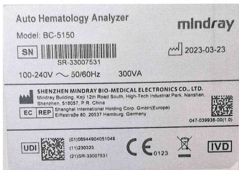
Рисунок 1.2 – Фотография маркировки анализатора гематологического автоматического BC-5150 № SR-33007531