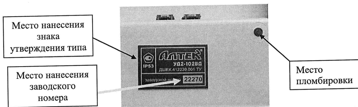
Рисунок 2 – Место нанесения знака утверждения типа, заводского номера и пломбировки дефектоскопа