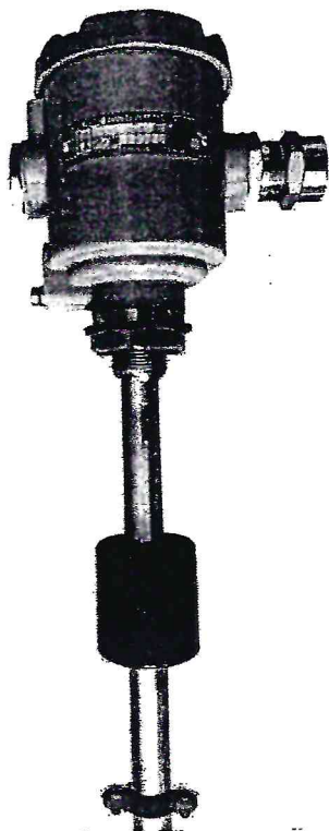
Рисунок 1 - Общий вид преобразователя

Сокращённое условное обозначение преобразователя в буквенно-цифровом формате и заводской номер преобразователя в цифровом формате наносятся на информационную табличку, размещённую на корпусе преобразователя, способом лазерной или ударно-точечной маркировки. Нанесение знака поверки на преобразователь не предусмотрено.