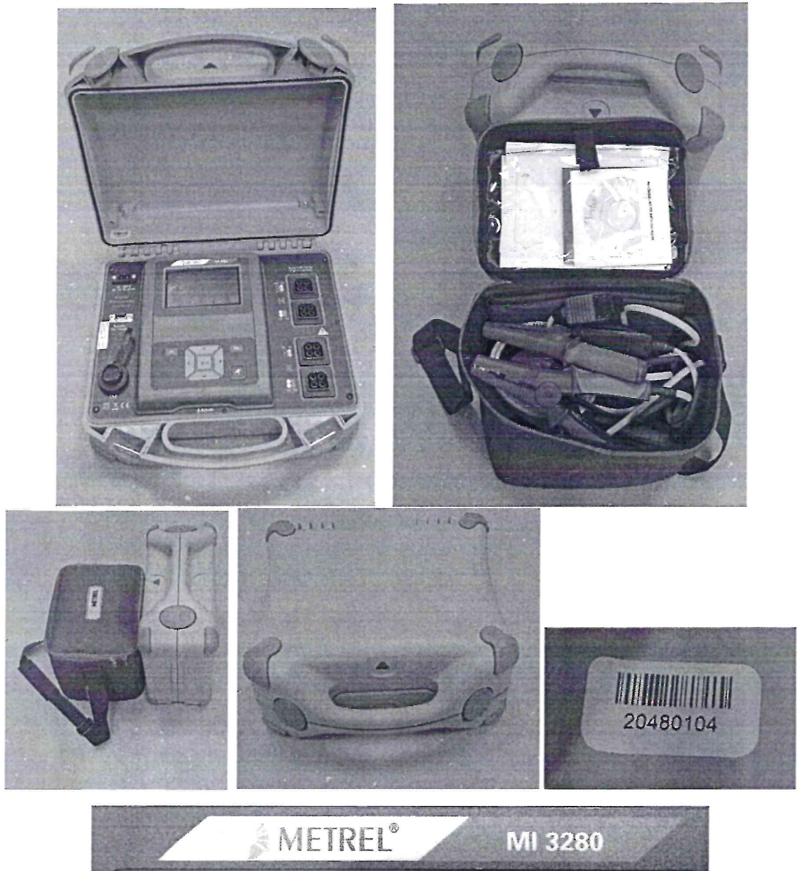
Рисунок А.2 – Внешний вид и маркировка анализатора параметров трансформаторов MI3280