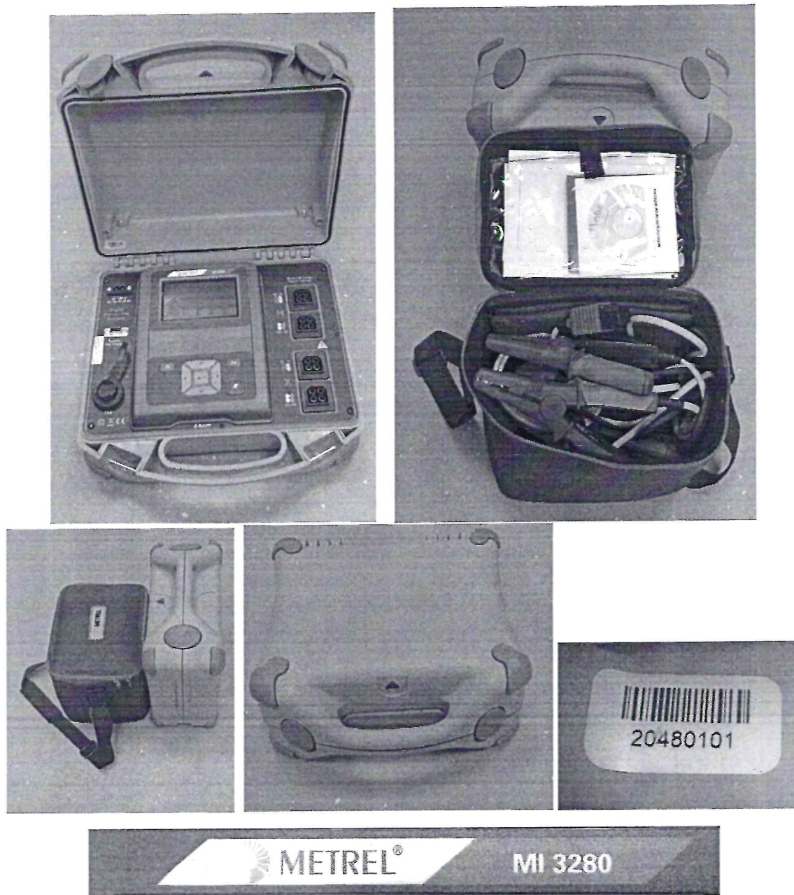
Рисунок А.2 – Внешний вид и маркировка анализатора параметров трансформаторов MI3280