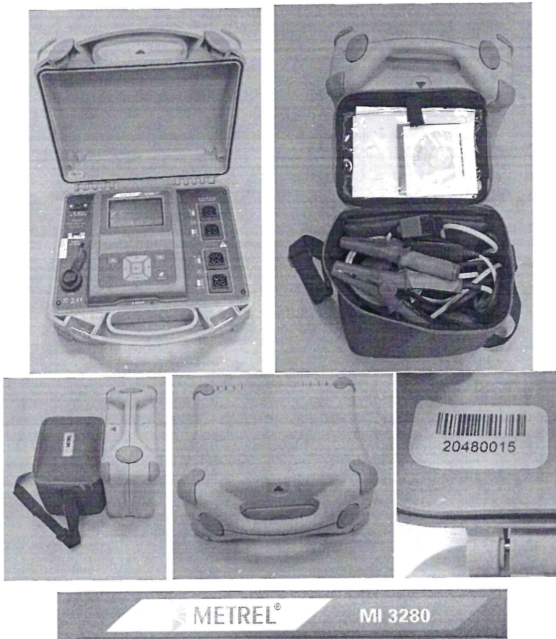
Рисунок А.2 – Внешний вид и маркировка анализатора параметров трансформаторов MI3280