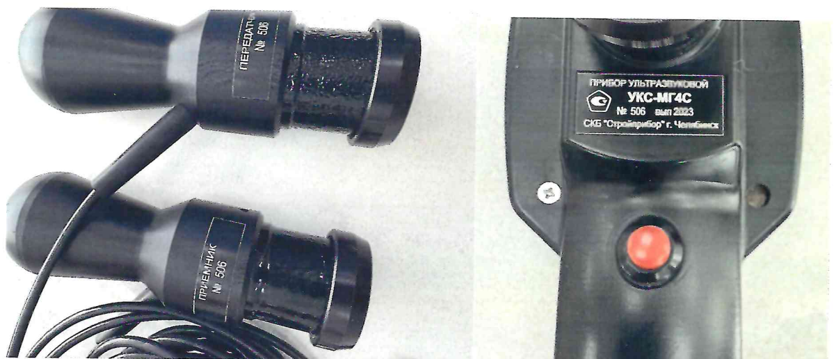
Рисунок 1.1 – Фотографии общего вида и маркировки прибора ультразвукового УКС-МГ4С № 506 в составе – электронный блок (измеритель ультразвуковой) и преобразователи ультразвуковые (передатчик № 506, приемник № 506)