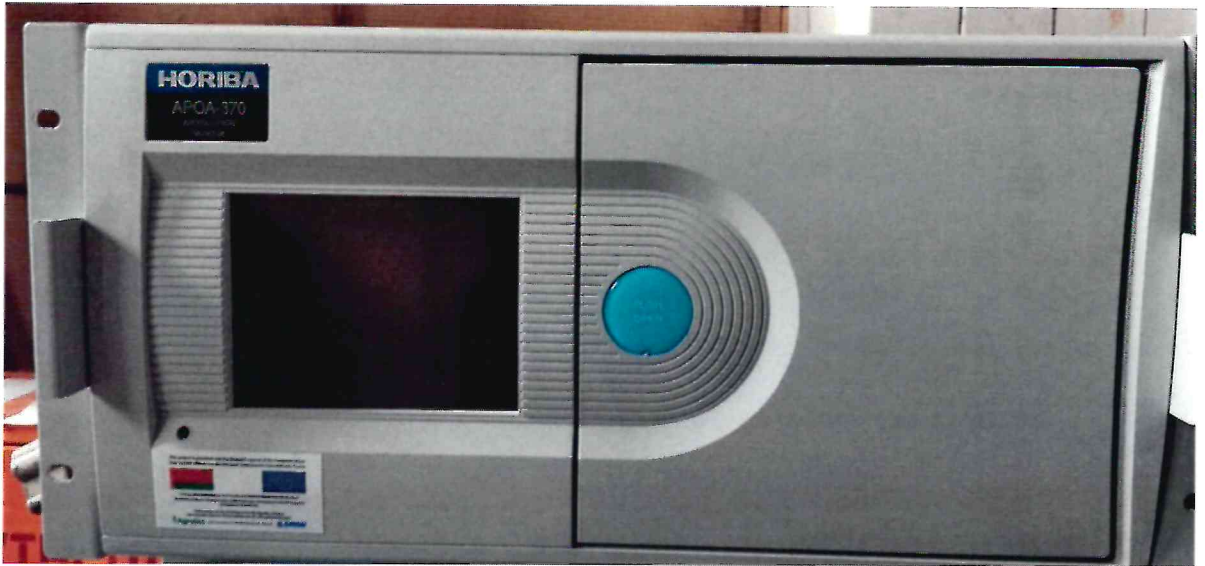
Рисунок 1.1 – Фотография общего вида анализатора озона APOA-370 № 904680