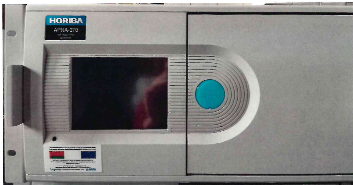
Рисунок 1.1 – Фотография общего вида анализатора окислов азота APNA-370 № 904727