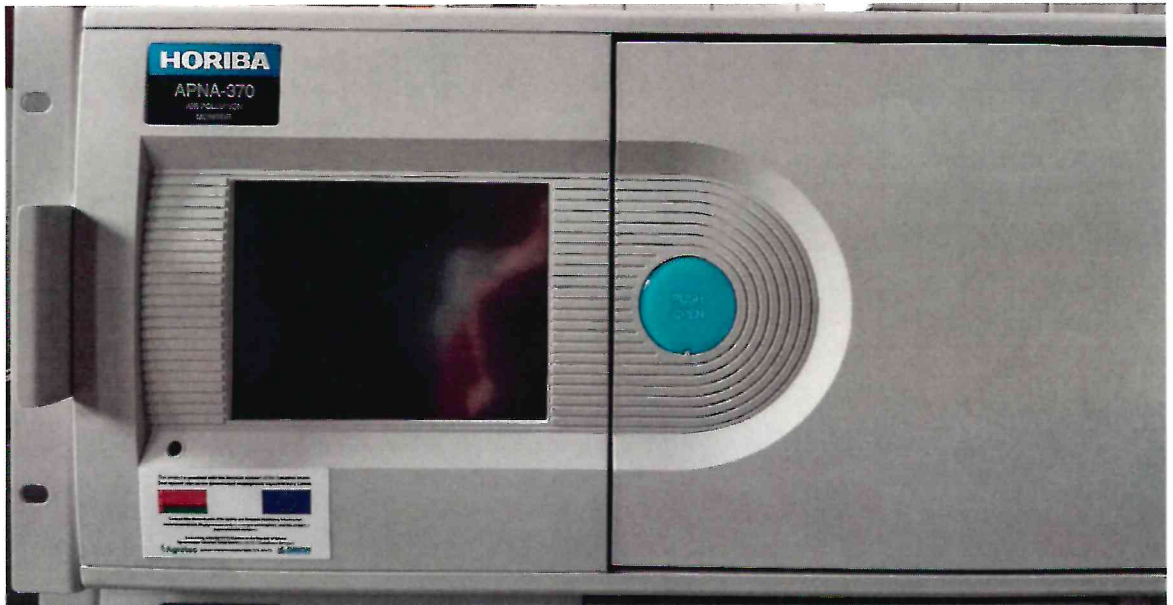
Рисунок 1.1 – Фотография общего вида анализатора окислов азота APNA-370 № 904724