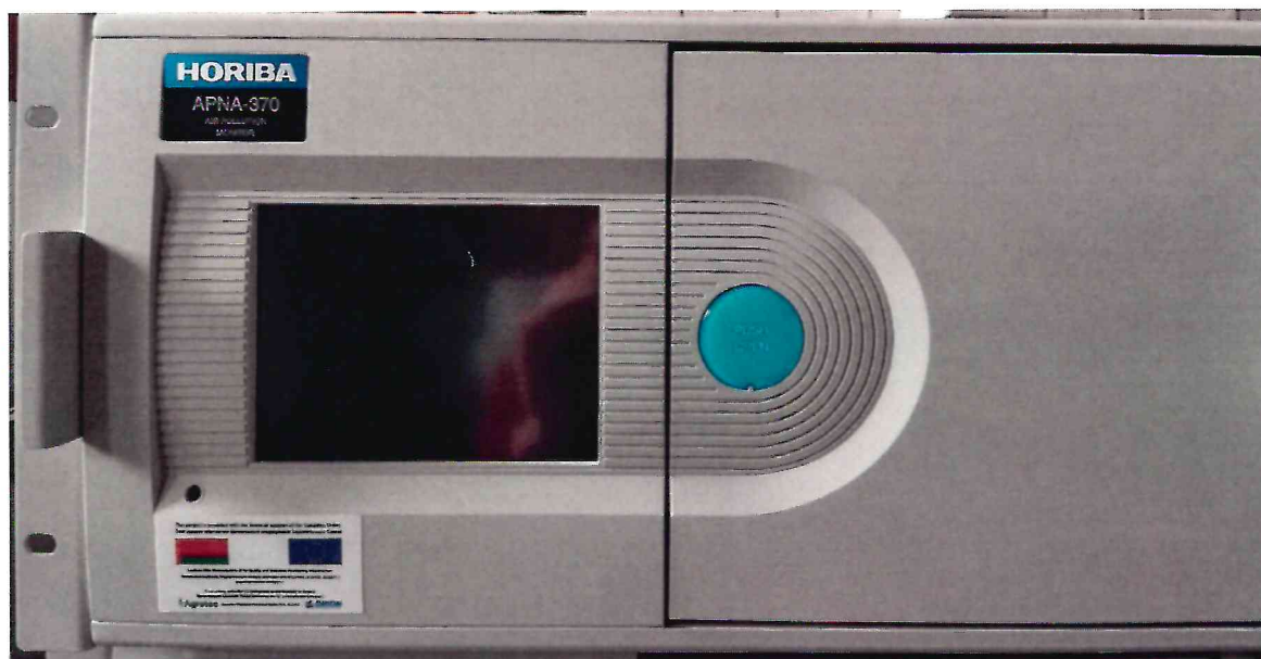
Рисунок 1.1 – Фотография общего вида анализатора окислов азота APNA-370 № 904723