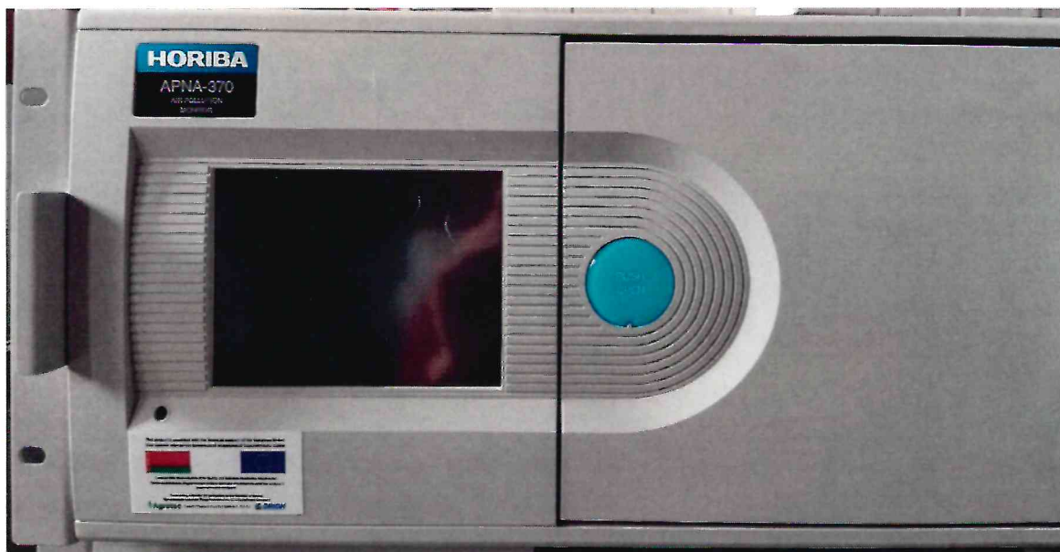
Рисунок 1.1 – Фотография общего вида анализатора окислов азота APNA-370 № 904735